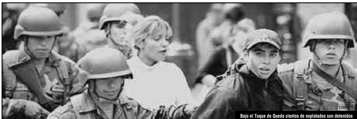
Bajo el Toque de Queda cientos de explotados son detenidos

Estado y la patronal garanticen el salario de los obreros que han perdido su trabajo! ¡Por una reforma agraria para entregarle tierra a los campesinos pobres! ¡Por granjas colectivas con fuerte inversión del Estado!