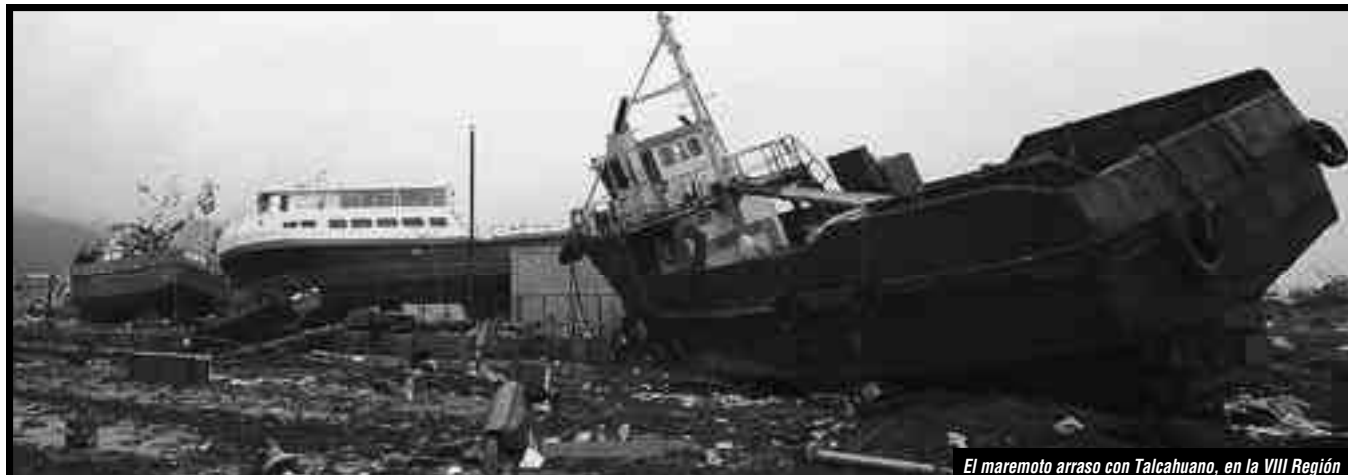
El maremoto arrasó con Talcahuano, en la VIII Región