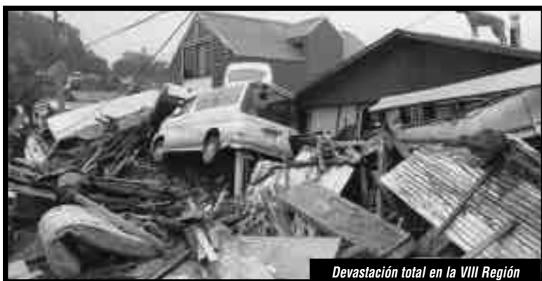
Devastación total en la VIII Región

Para resguardar la gran propiedad y las instituciones del Estado burgués, mientras la clase obrera ha puesto miles de muertos, desaparecidos y soporta el flagelo del hambre, la sed y la total miseria como en Haití