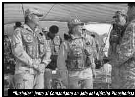
"Bushelet" junto al Comandante en Jefe del ejército Pinochetista

¡ABAJO EL "TOQUE DE QUEDA" ASESINO DE LAS MASAS! ¡FUERA EL EJÉRCITO PINOCHETISTA GENOCIDA!