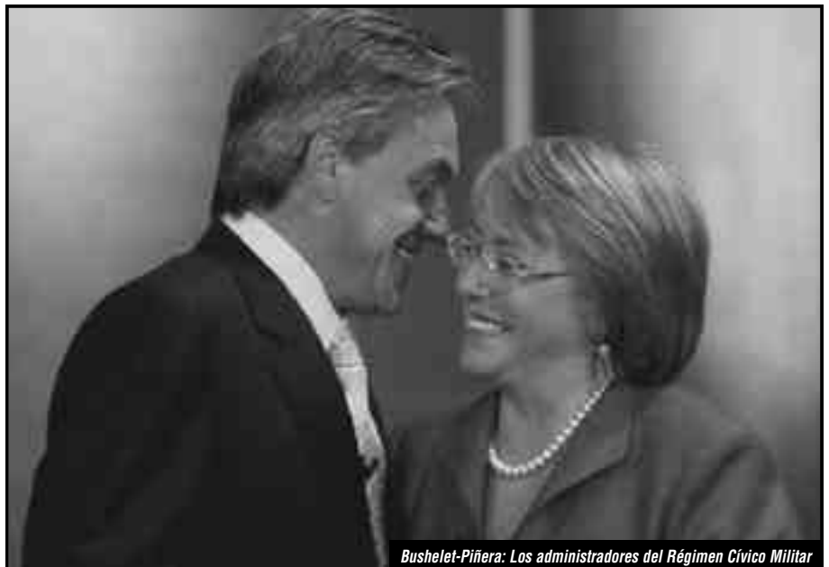
Buschelet-Piñera: Los administradores del Régimen Cívico Militar

La catástrofe que golpeó terriblemente a Chile de los obreros y explotados se ha cobrado la vida de más de un millar de personas, al momento que se estima que son más de quinientos los desaparecidos y hay ciudades y pueblos sobre los que no se sabe cuál es su situación, como en Ñuble y Arauco. Más de 1 millón y medio de casas quedaron destruidas. En Concepción, en decenas de edificios, familias enteras quedaron atrapadas entre los escombros, cuando todavía no se logran rescatar cientos de cadáveres que yacen bajo las ruinas. Además decenas de ciudades y