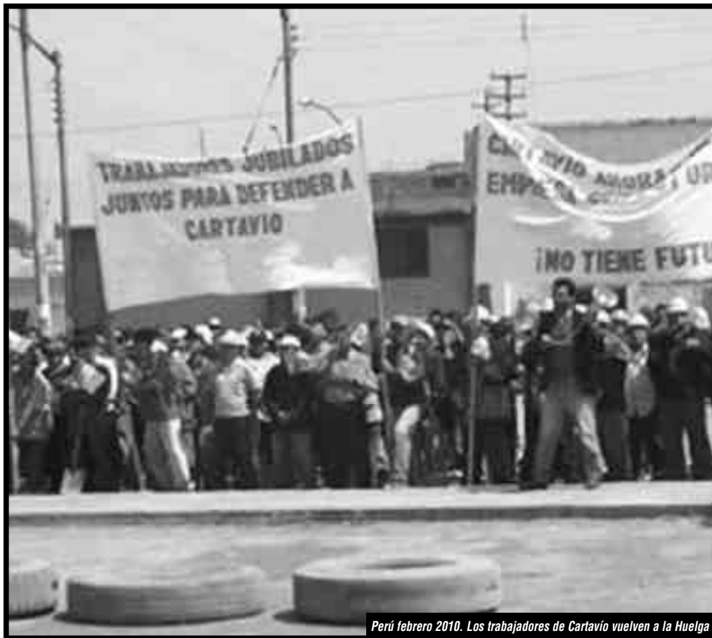
Perú febrero 2010. Los trabajadores de Cartavio vuelven a la Huelga

Unifiquémonos con las bases obreras en lucha para romper con el aislamiento que nos impone la burocracia de la CGTP y la izquierda reformista