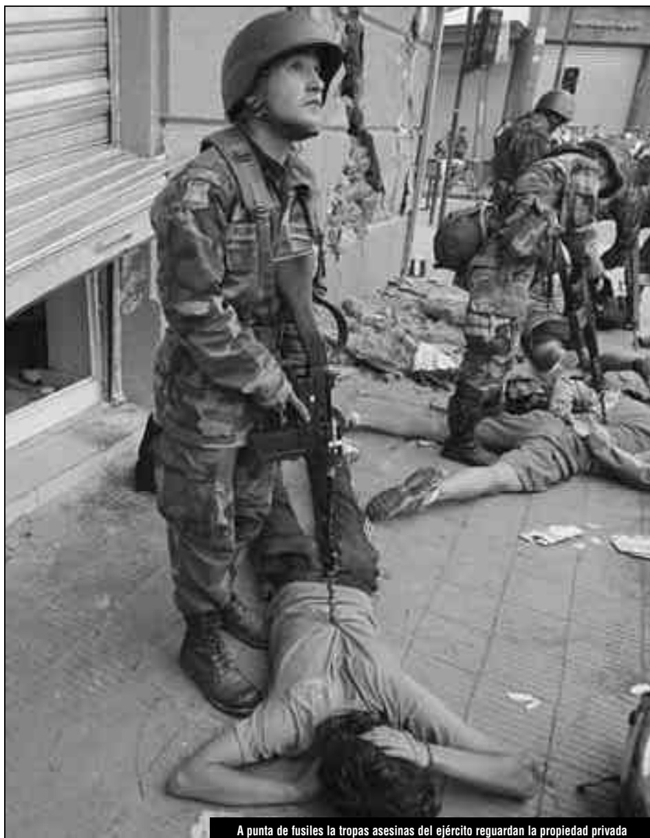
A punta de fusiles la tropas asesinas del ejército guardan la propiedad privada

¡Basta de hambre, Chile es el primer agroexportador de Latinoamérica! ¡expropiación de las cadenas de supermercados, de los grandes acaparadores, formando comités de abastecimiento a nivel nacional para llevar el agua y la comida a quienes no lo tienen! ¡expropiación bajo control obrero y sin indemnización de las transnacionales agroindustriales y ganaderas para que haya alimentos, carne, leche, verduras, frutas para las familias que lo han perdido todo! ¡que el