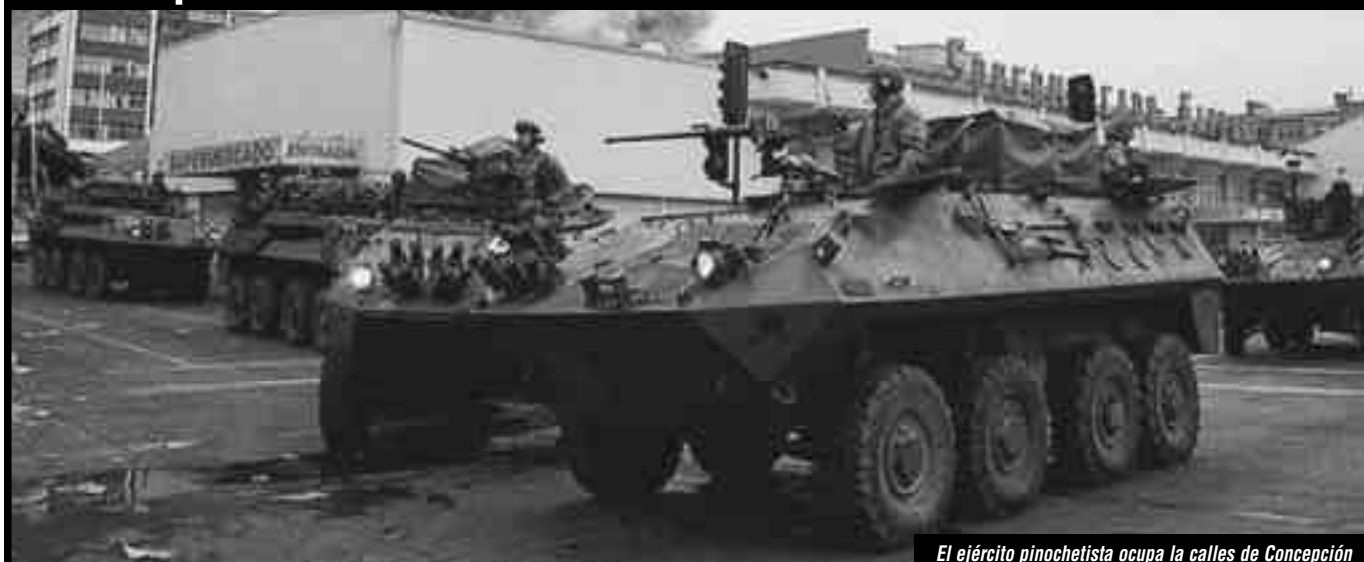
El ejército pinochetista ocupa la calles de Concepción

¡ABAJO EL "TOQUE DE QUEDA" ASESINO DE LAS MASAS! ¡FUERA EL EJÉRCITO PINOCHETISTA GENOCIDA!