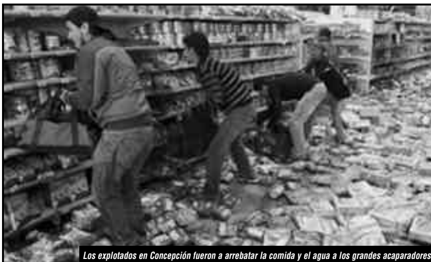
Los explotados en Concepción fueron a arrebatarse la comida y el agua a los grandes acaparadores

Para poder comer, reconstruir las viviendas, conseguir atención médica y garantizar el trabajo de las masas hay solución: